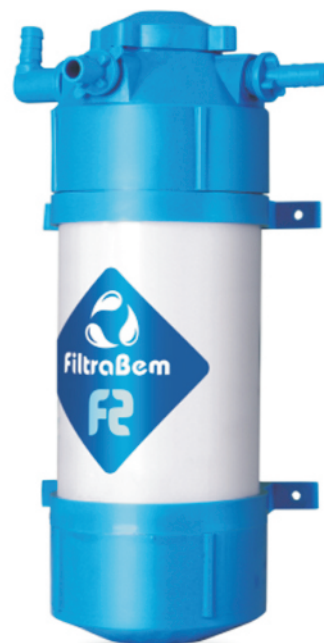
PWS - F2

Os Filtros PWS F1 e F2 são uma garantia total de qualidade do bem estar e da saúde. A importância da água na vida humana é fundamental para a saúde de todos. O Filtros PWS é ideal para a família e perfeito para indústria e comércio. Os filtros PWS oferecem a máxima tecnologia em sistemas de purificação de água, garantido confiança e segurança.