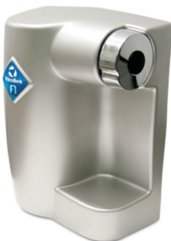
PWS - F1